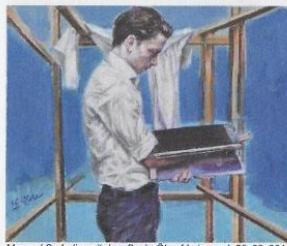
Masoud Sadedin, mit dem Buch, Öl auf Leinwand, 50x60, 2016

Vom 7. September bis 18. Oktober wurden nun in der Gegenausstellung „Transfer“ in der art by BERTHOLDVILLA Arbeiten der KünstlerInnen des Kunsthauses Troisdorf gezeigt. Präsentiert wurden aktuelle Arbeiten der