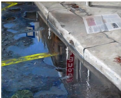
Somogyi Márton, Bus stop, Öl auf Leinwand, 85x105 cm